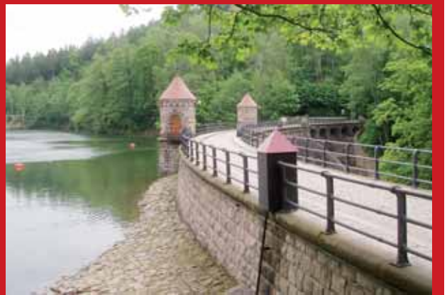
Dnešní pohled na hráz.