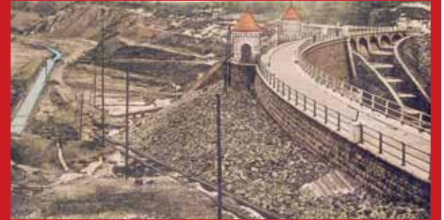
Stavba liberecké přehradě na Harcovském potoce v roce 1904. Na snímku je reprodukce kolorované fotografie Antona Heina.

V naší rubrice si připomínáme doby dávno minulé a porovnáme obrázky z různých údobí minulého a předminulého století se současností.