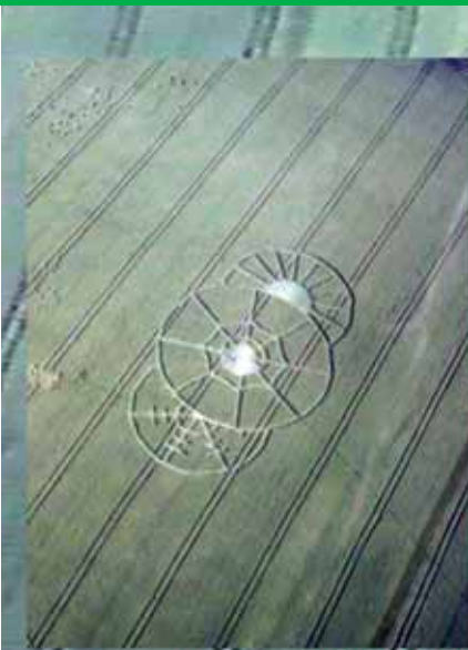
Agrosymbol u Jítravy z leteckého pohledu.

Muži s virgulemi v rukou procházeli jednotlivé části obrazce a tu a tam vykřikovali cosi o negativní energii proudící ze středu obrazce. Agrosymboly, což je správný název