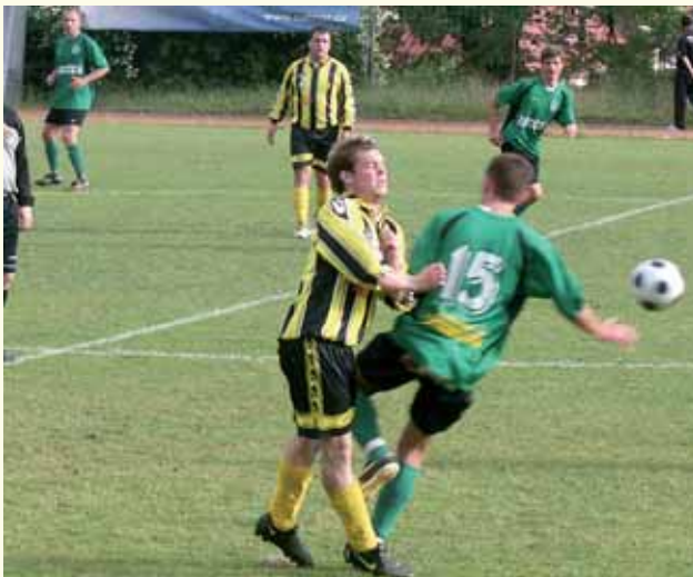
V posledním utkání sezony 2007/08 vyhráli fotbalisté Vratislavice nad Českým Dubem 3:1, ale nyní převažují v klubu spíše chmury a nejistota z budoucnosti.