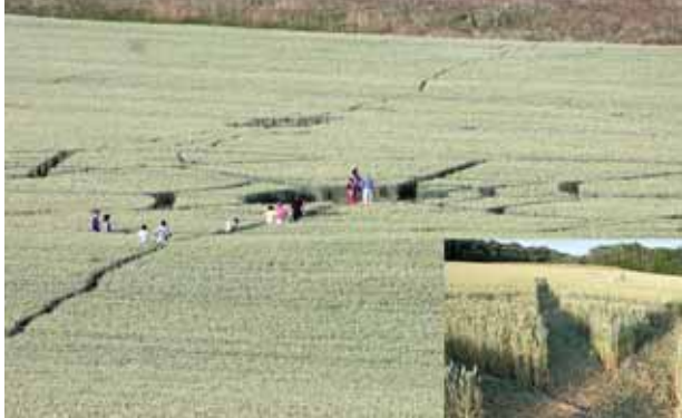
Podobný obrázek jste mohli vidět ze silnice do Liberce. Vpravo: detail obrazce.

Dokončení ze strany 1. K loňskému obrazci u obce Honsob například Circlemakers uvádějí: „Anomálie v tomto případě byly menšího rozsahu. Jednomu badateli se při focení u země vymazávaly fotky z fotoaparátu, cesna vylétající z blízkého letiště ztratila orientaci a zabloudila až ji musely navádět gripeny. Místní také přestali používat zkratku přes pole do blízké vesnice, protože se tady děly divné věci. Pravděpodobně tu někdo procházel při vzniku obrazce zrovna ve chvíli, kdy se nemohla najít jedna ze středových značek. Sám jsem byl svědkem rámsu pekelného a pohybu lidí po kolenou rychlého, snad peklo samo otevřelo své brány, aby pohltilo a nakonec samo navrátilo středovou značku z ďábelského