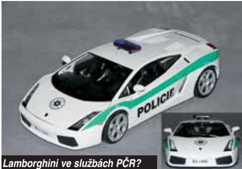
Lamborghini ve službách PČR? Kdepak, je to jen model.

"Nejvíce jsou v Liberci zastoupeny Škody Felicie a Škody Fabie. Dále pak Škody Octavie. Skupina dopravních nehod využívá k výjezdům vozidla VW, která jsou uzpůsobena jako mobilní